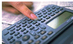
ใส่รหัสตัวเลข 5 ตัว ของบริษัท