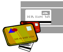
บัตร ATM/ เครดิต