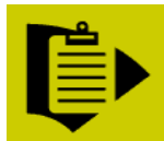
เลือกทำรายการ ชำระเงิน